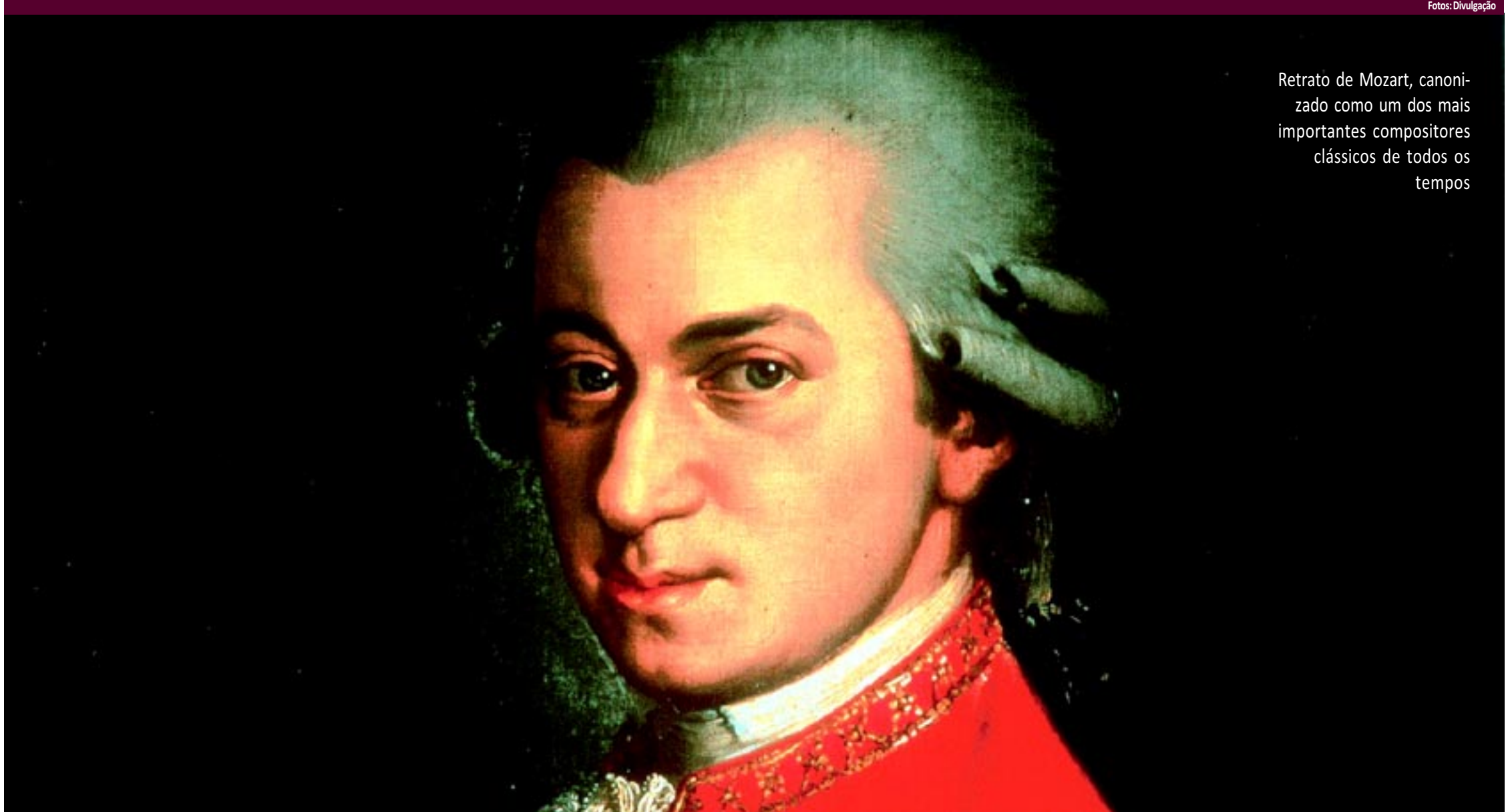
Retrato de Mozart, canoni- zado como um dos mais importantes compositores clássicos de todos os tempos

Missa fúnebre foi a última obra do mestre austríaco, e teria sido escrita para o seu próprio funeral