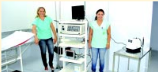
Sala de endoscopia com ambiente para recuperação