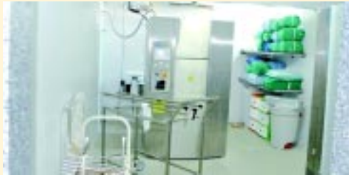
Máquina de autoclave para esterilização dos instrumentos