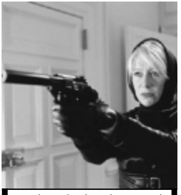
Matadores de Aluguel na Record