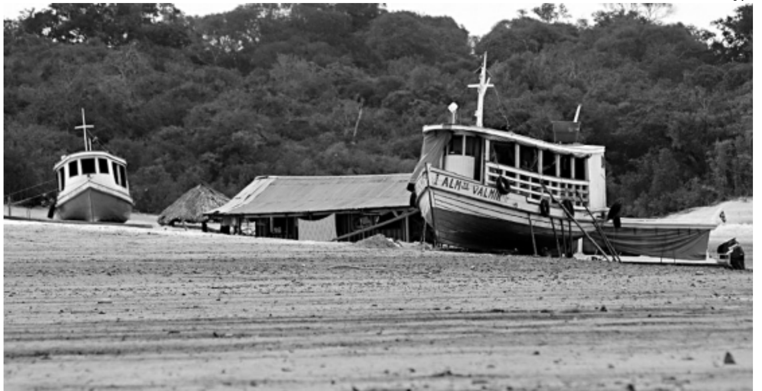
Ano passado, o rio Negro apresentou seca histórica; a redução do volume este ano preocupa porque está acontecendo antes da época de estiagem

Quando as facções se encontraram, segundo a PM, começaram uma briga generalizada que só foi dissipada com a chegada de policiais do 23º Batalhão da Polícia Militar.