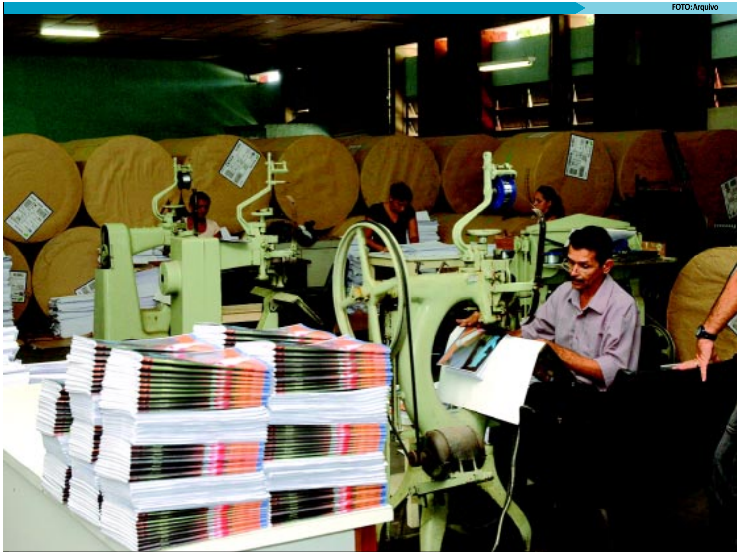
A União, último jornal da imprensa oficial, será apresentado como modelo para os demais Estados por não veicular apenas temas de interesse do Governo

Na sua opinião, esse exemplo deve ser seguido