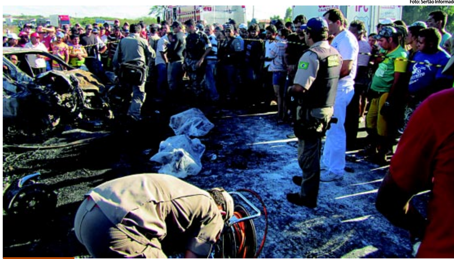
NO SERTÃO | Duas pessoas morreram carbonizadas em acidente de carro na BR-230 PÁGINA 11

Energisa. O prazo final para o recadastramento é 1º de novembro. As famílias beneficiadas pela Tarifa Social ganham um desconto que chega até 65%. PÁGINA 12