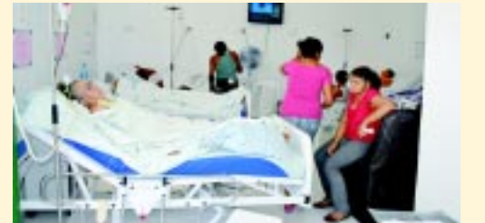
Nova enfermaria com TVs e purificadores de água