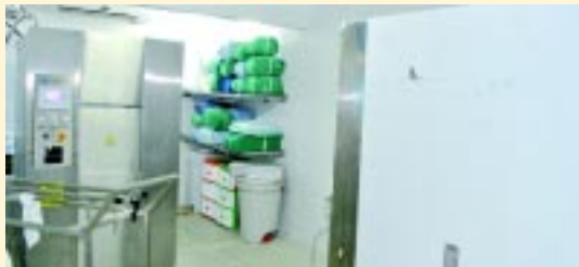
Unidade tem 2 máquinas modernas de autoclave disponíveis