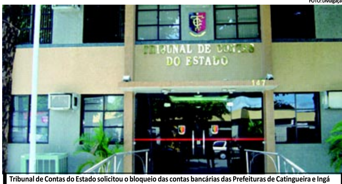
Tribunal de Contas do Estado solicitou o bloqueio das contas bancárias das Prefeituras de Catingueira e Ingá

COMÉRCIO - Anteontem, o governador e a comitiva tiveram um encontro com o ministro do Comércio Exterior e Investimentos Estrangeiros de Cuba, Rodrigo Malmierca Díaz, que afirmou que seu Governo está pronto para estabelecer relações comerciais com o Brasil. Ele destacou o interesse em estimular a compra de calçados paraibanos para abastecer o mercado interno, que possui grande demanda.