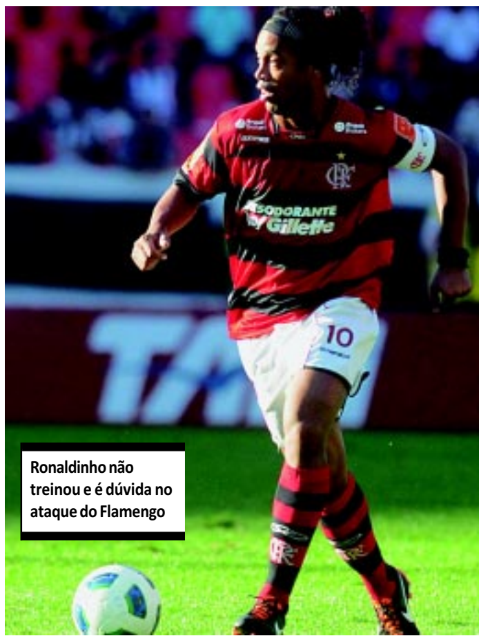
Ronaldinho não treinou e é dúvida no ataque do Flamengo