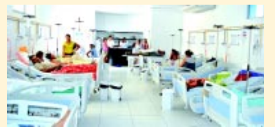
Sala amarela de triagem