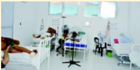
Novas enfermarias bem equipadas