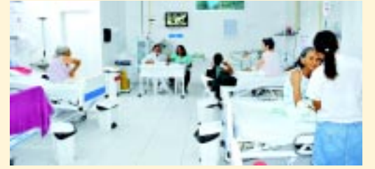
Enfermaria com a presença de enfermeiro da unidade 24 horas