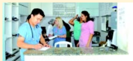
Posto Médico com boa estrutura