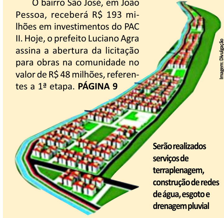
Serão realizados serviços de terraplenagem, construção de redes de água, esgoto e drenagem pluvial

O bairro São José, em João Pessoa, receberá R$ 193 milhões em investimentos do PAC II. Hoje, o prefeito Luciano Agra assina a abertura da licitação para obras na comunidade no valor de R$ 48 milhões, referentes a 1ª etapa. PÁGINA 9