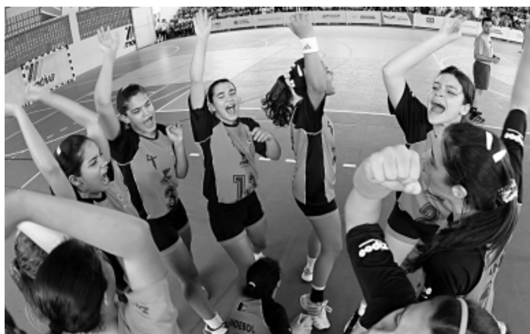
Reforçada, a equipe de handebol do Motiva será uma das favoritas ao título do Brasileiro em João Pessoa