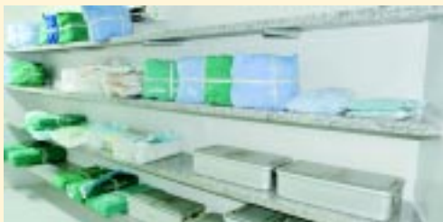
Sala com objetos esterilizados e prontos para usar