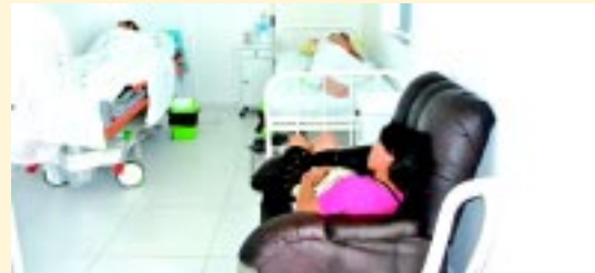
Nova enfermaria tem acomodações confortáveis