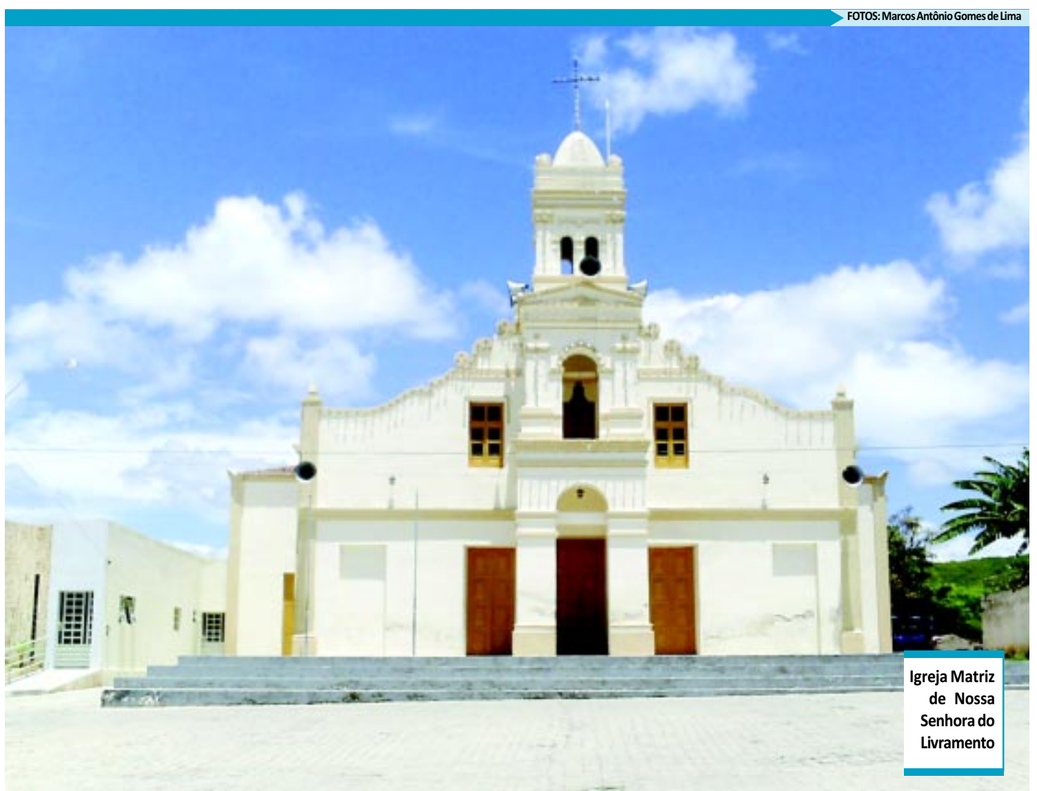
Igreja Matriz de Nossa Senhora do Livramento