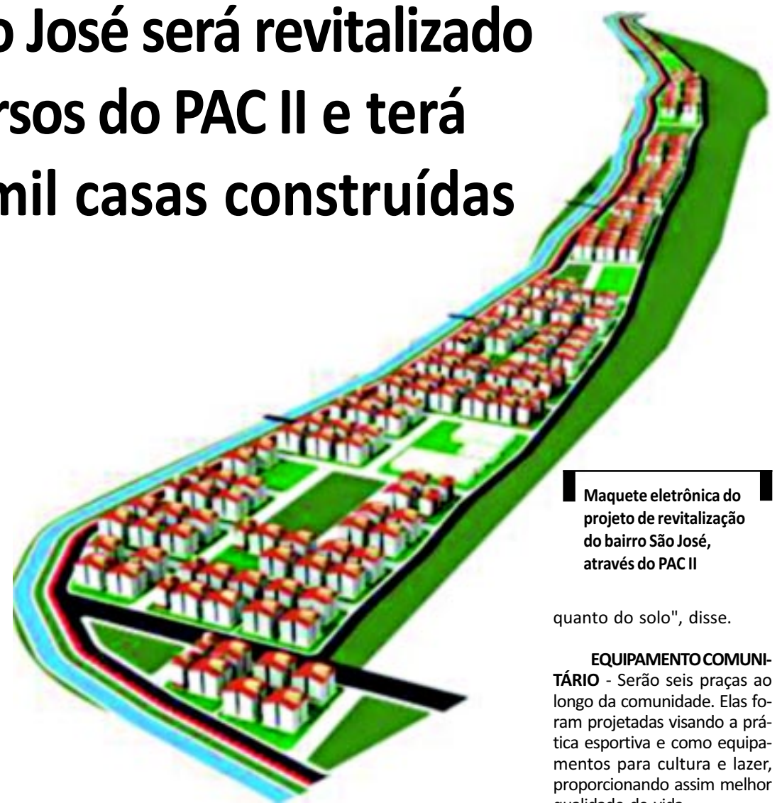
Maquete eletrônica do projeto de revitalização do bairro São José, através do PAC II