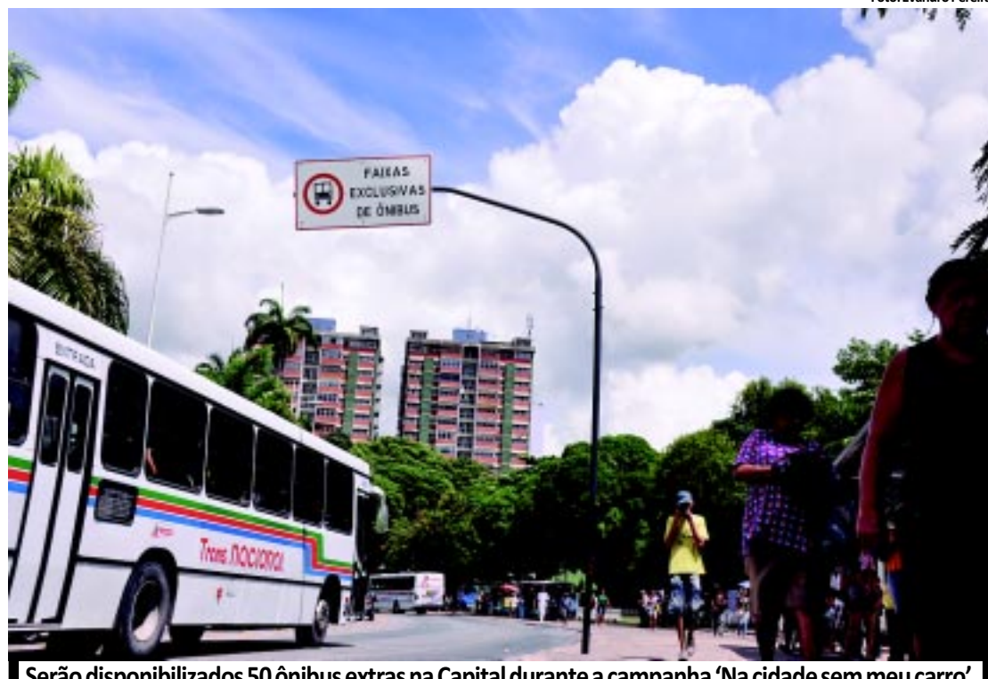
Serão disponibilizados 50 ônibus extras na Capital durante a campanha 'Na cidade sem meu carro'