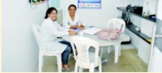
Central de doação e captação de órgãos