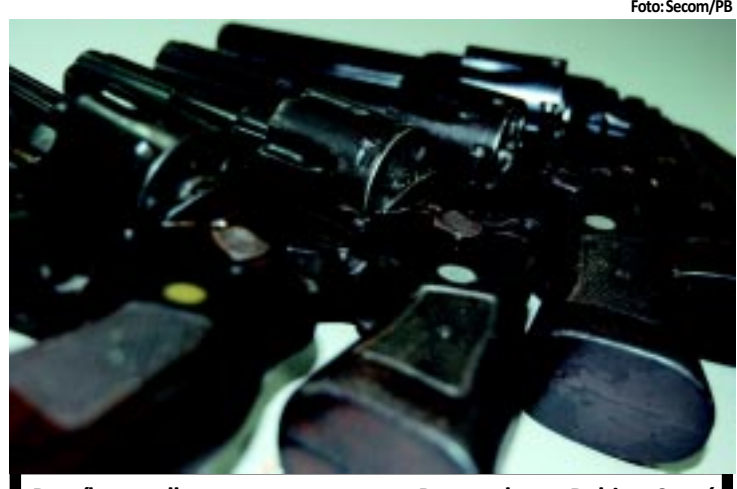
Paraíba recolheu menos armas que Pernambuco, Bahia e Ceará

o Estado em 4º lugar no ranking de entrega de armas do Nordeste. Em todo País foram 22,2 mil armas recolhidas. PÁGINA 8